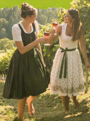
Weingenuß in Ligist