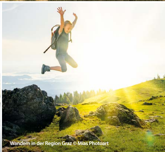
Wandern in der Region Graz