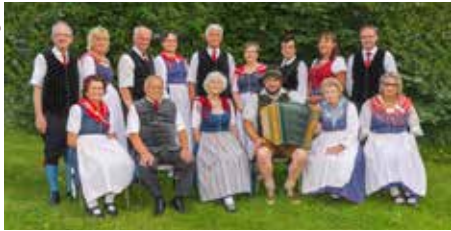
Die Junggebliebenen Volkstänzer aus Wolfsberg

© Die Junggebliebenen Volkstänzer aus Wolfsberg