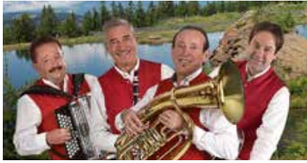
Die 4 Lavanttaler